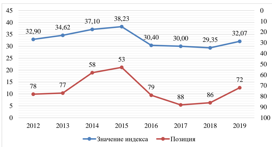
Рисунок – Значения итогового индекса (слева) и позиции (справа) Республики Беларусь в Глобальном индексе инноваций в 2012 – 2019 гг.

В 2019 г. продолжена положительная тенденция улучшения позиции Беларуси в ГИИ (2018 г. – 86 место, 2017 – 88). Результат 2017 г. (88 место) является наихудшим для Беларуси за всю историю нахождения нашей страны в рейтинге ГИИ. При этом более высокое место по сравнению с 2019 г. Беларусь занимала лишь в 2014 г. и 2015 г., когда наша страна заняла 58 и 53 позиции соответственно (рисунок).