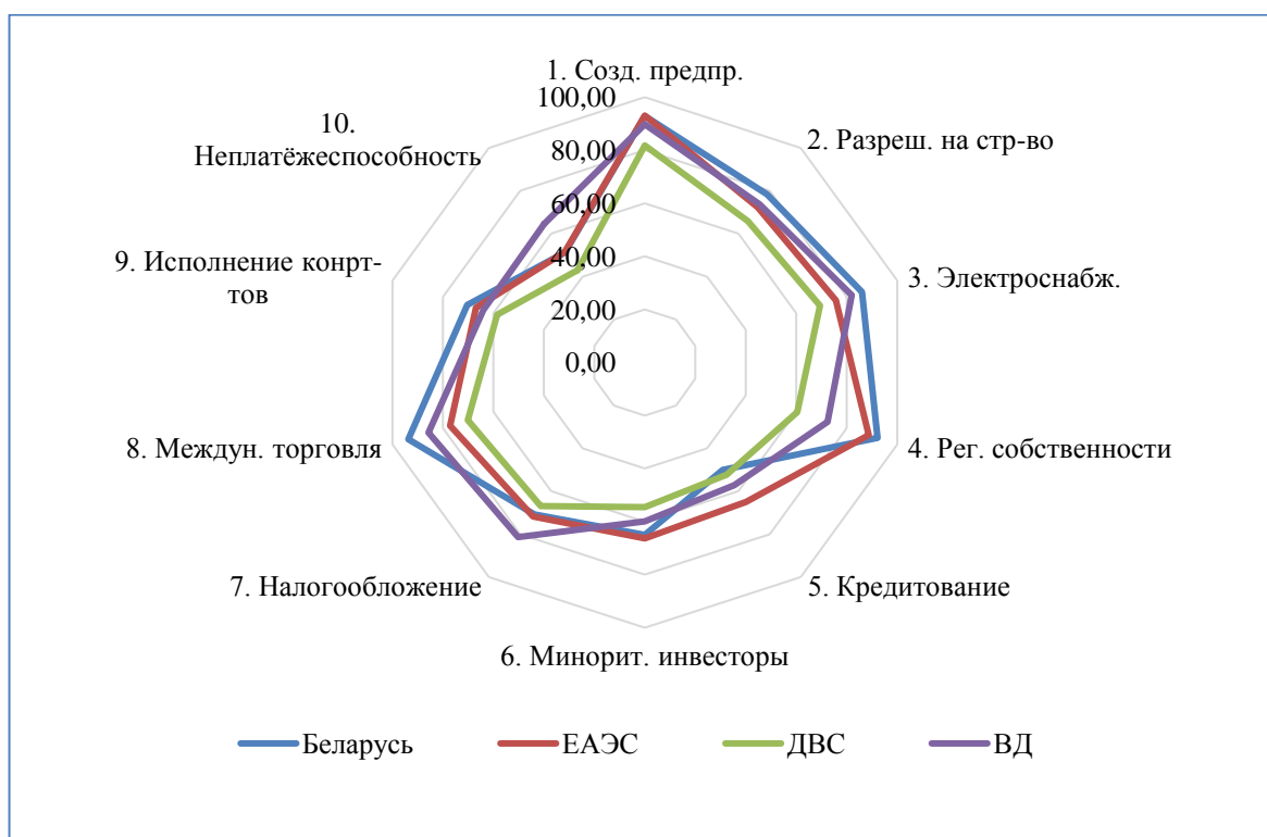
Рисунок — Страновой профиль Республики Беларусь в рейтинге «Ведение бизнеса» на 2018 год в сравнении со средними значениями по группам стран

3. «Подключение к системе электроснабжения»: показатель удалённости от передового рубежа составляет 86,04%, что соответствует 25 месту в рейтинге. По данному показателю Беларусь также опережает средние значения по трём группам стран.