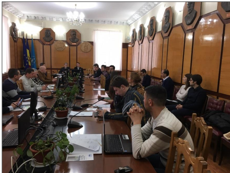
Семинар «Инновации в области энергоэффективности и возобновляемых источников энергии», 14.12.2014